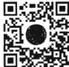
หนังสือนัดประชุม และระเบียบวาระการประชุม สภาผู้แทนราษฎร

การนัดประชุมได้แจ้งให้สมาชิกทราบทางสื่ออิเล็กทรอนิกส์เรียบร้อยแล้ว และท่านสมาชิกสามารถอ่านเอกสารประกอบการประชุมสภาผู้แทนราษฎรได้ โดยการสแกน QR Code หรือทาง www.parliament.go.th