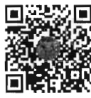
กระทู้ถามสด ด้วยวาจา